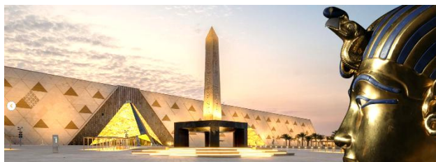
nou Gran Museu Egipci – El Caire