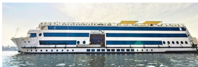
vaixell Ms. Blue Shadow, cat premium